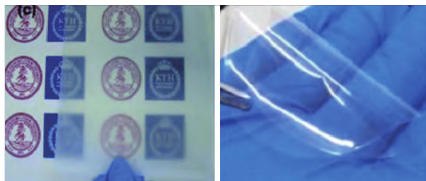
图5 由 CNF 分散液制备的透明纸

的机械能转换成电能并收集起来。直接书写打印 (DIW) 属于3D打印的一种, 能根据传入设备的文件将所需的材料逐层打印, 可以提高制造器件的精度, 进而提高纳米发电机的性能。桉木漂白硫酸盐浆加入其他试剂在一定条件下可以通过氧化-高压均质法制备出DIW所需的