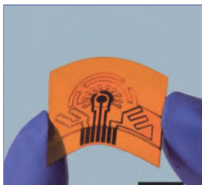
图4 多模态汗液传感器