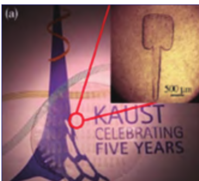
图3 LED 器件的银纳米线、纳米纸电极